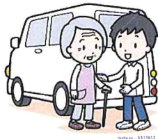
通院に伴う車の乗り降りなど