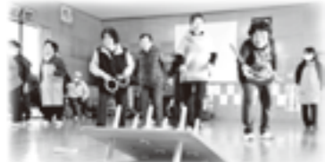
やまびこネットワーク事業