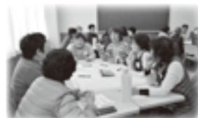
ボランティア養成講座