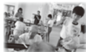
ワークキャンプ事業