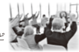
デイサービス事業