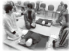
幼児安全法講習会