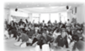
ボランティアまつり