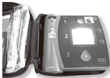
37. AED(自動体外式除細動器)

※突然の心肺停止など、救命にかかせない装置です。 ※貸し出しは救急法講習を受講された方、使用方法を理解されている場合に限りです。