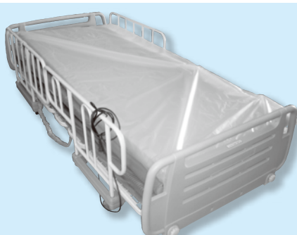
63. 電動ベッド(マット消毒料がかかります)