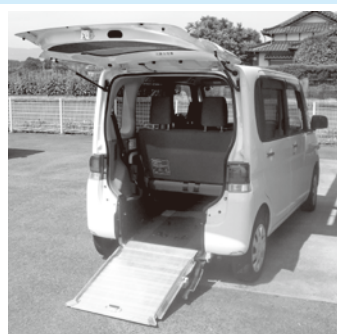
64. 軽リフト (車イスのまま病院受診などが出来ます)