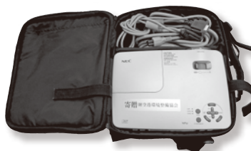
4. ビデオプロジェクター