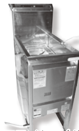
18. フライヤー(ガス式)