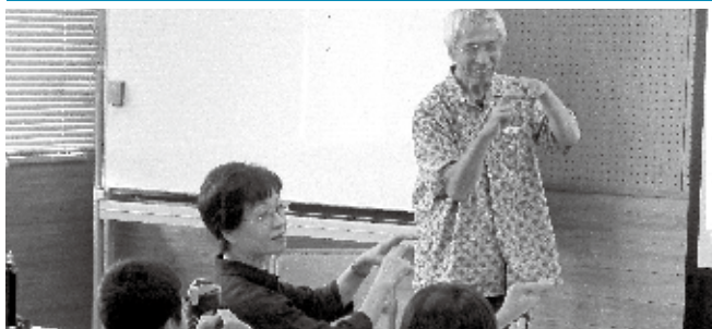
小中学校ボランティア協力校助成・ボランティアスクール・ボランティア体験学習・やまびこふれあいだより・小学校卒業記念・一人親世帯支援