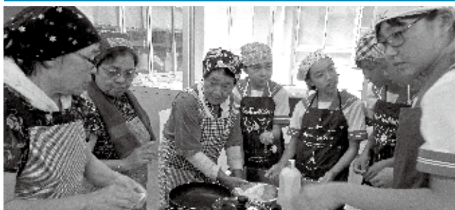
90歳以上お祝い訪問、ダイヤモンド婚、金婚式、伝承遊び交流会、福祉球技大会、老人クラブ活動、シルバーヘルパー活動