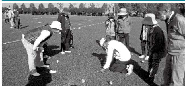
県・郡スポーツ大会・親睦会・球技大会・りんどうの会・手話講座 たんぼぼハウス活動支援