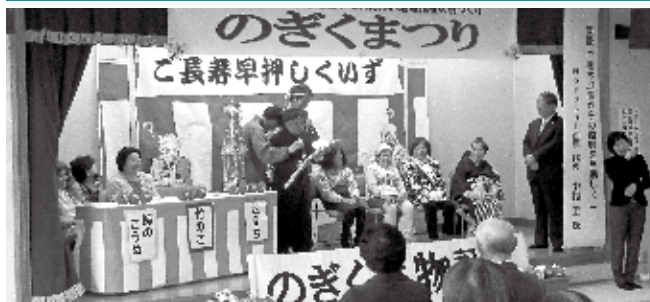
シニアカレッジ支援・のぎく荘だより・ボランティア活動保険、福祉協力員支援、防災備蓄資材整備助成