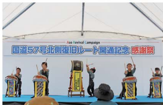
配分金事業による活動の様子 (山田保育園)

上記以外にも、スーパーやコンビニ等に募金箱を設置しておりますので、ご協力宜しくお願い致します。