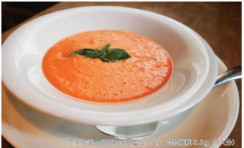
エネルギー 200kcal 塩分 1.0g 食物繊維 3.3g (1人分)