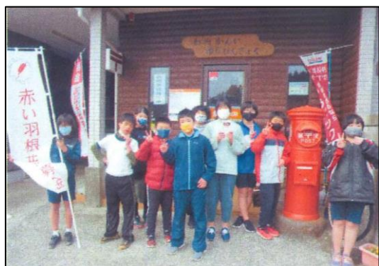
中原小学校 独居高齢者へのハガキ投函