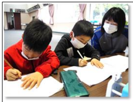
子どもデイサービス