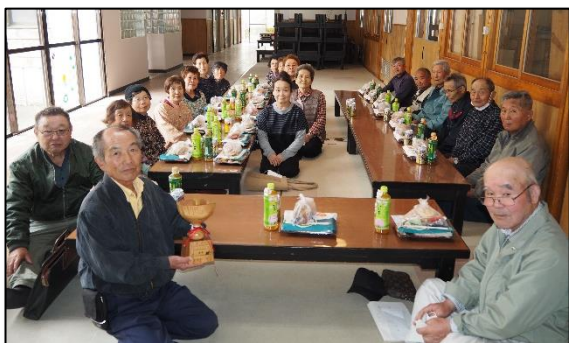
高齢者ミニデイサービス