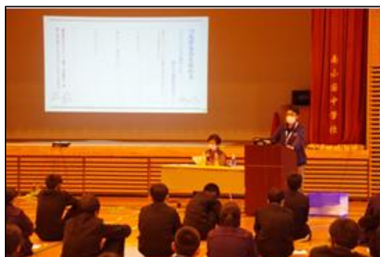
南小国中学校 福祉学習会

共同募金運動・募金に関するご質問は 熊本県共同募金会 南小国町分会(社会福祉協議会内) 42-1501まで