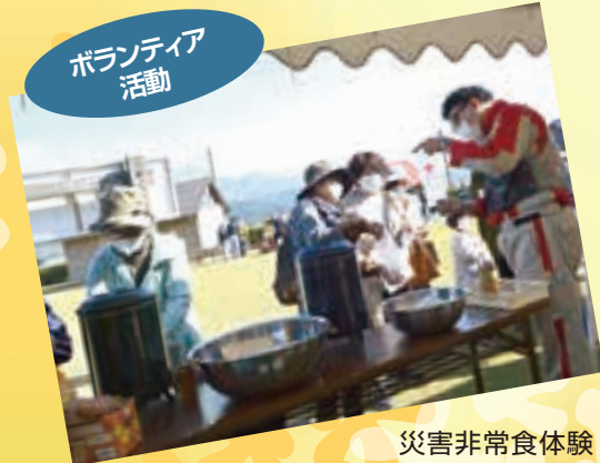
災害非常食体験 ハイゼックス