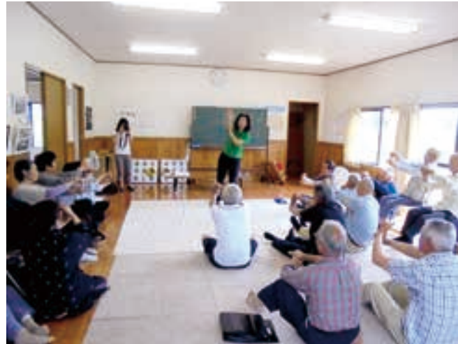
やまびこネットワーク事業 「ふれあいいいききサロンの様子」

区長さんのご協力を得てお願いしました令和3年度南阿蘇村社会福祉協議会の会費につきましては、村民の皆様のご協力により下記のとおり実績を上げる事が出来ました。村民の皆様の善意のこもった会費は「やまびこネットワーク事業」などの地域福祉の向上のために大切にに使わせていただきます。