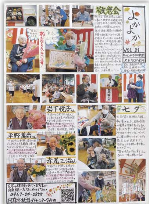
手づくり新聞「よかよか」