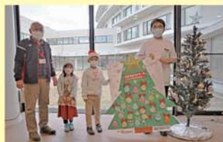
阿蘇医療センター