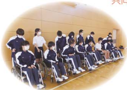
一の宮中学校による福祉教育