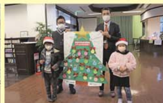
阿蘇やまなみ病院