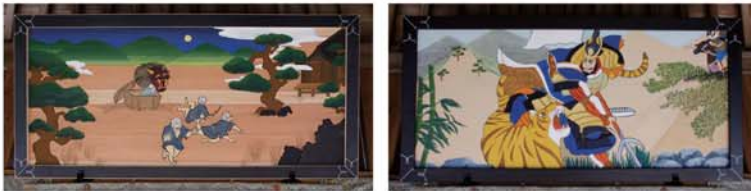
高校生によって修復された絵馬

皆が協力的でまとまっているので、このような活動が継続できている。絵馬について、縁あって修復のチャンスがあったので区の皆に提案し、賛同があり後世に残すことができる。今後も、若い世代に永草区のつながりや文化を継承していきたい。