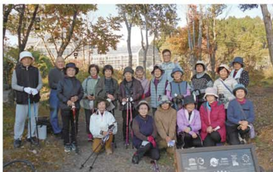
ノルディックウォーキング教室

新型コロナウイルス感染拡大を防止する為、開催を延期しておりましたが、ようやく活動が始まりました。受講生の皆さんは感染対策をしながら楽しく受講されています。