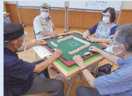
初心者向け健康麻雀教室