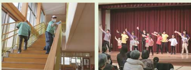
小学校の消毒ボランティア ボランティアふれあいまつり

ボランティア個人又は団体の賛同者でつくる組織で、どなたでもご加入いただけます。会員同士で情報交換や交流会、イベントの企画など行っています。例年2月には、「阿蘇市ボランティアふれあいまつり」を開催しており、今年度は3月20日（日）を予定しています。