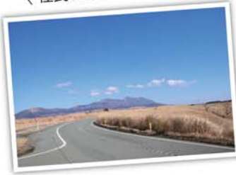
やまなみハイウェイから見る景色