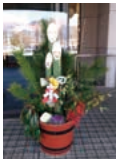
職員手づくりの門松で、“福”を迎え入れました。