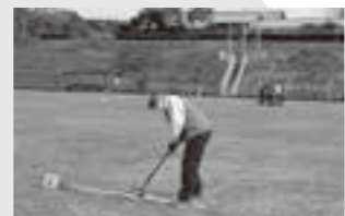
ナイス・ショット