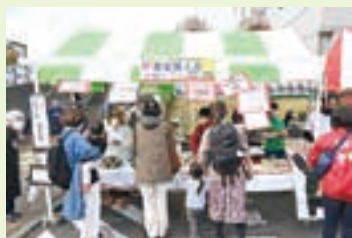
和光市民まつりの様子