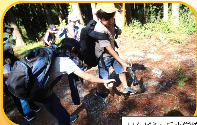
りんどうヶ丘小学校(R4.10/14 活動)