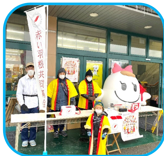
街頭募金活動(子どもに夢をはこぶ会)