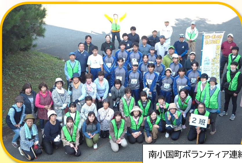
南小国町ボランティア連絡協議会(R4.10/2 活動)