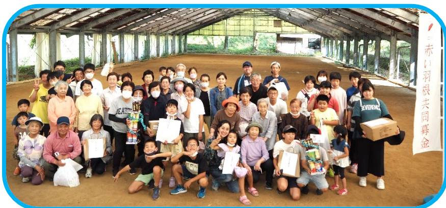
地域を明るくするモルック大会 (10/2 開催)