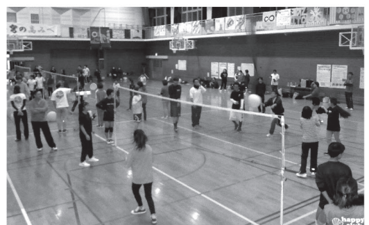
赤い羽根共同募金杯 フラバレーボール大会