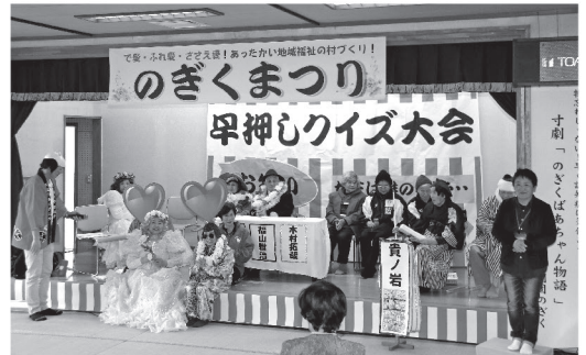
のぎくまつりの開催