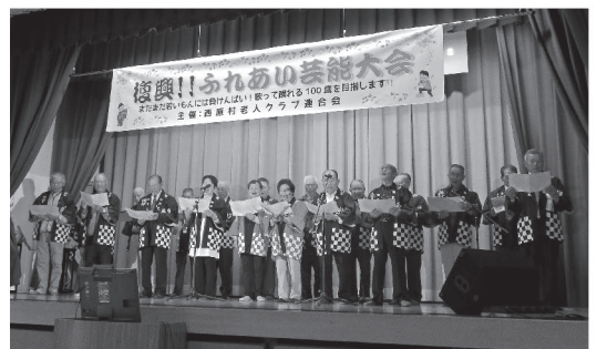
生きがい活動(老連芸能大会)