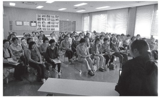
シルバーヘルパー全体会