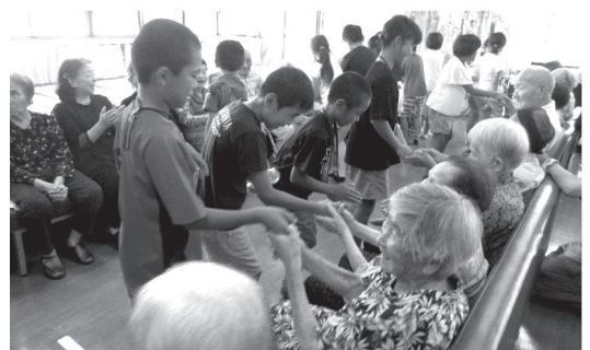
福祉体験学習やボランティア体験活動