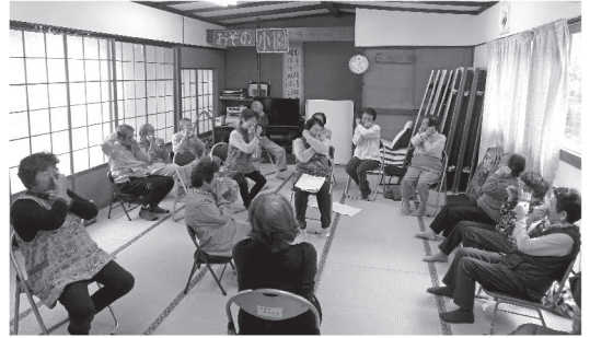
村内 33 集落で開催されている「ふれあいいきいきサロン」今後は、週 1 回開催の「スーパーサロン」を推進します。