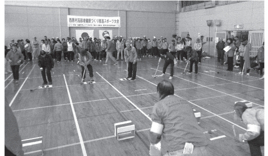
高齢者や障がい者のスポーツ大会