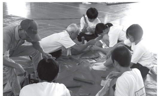
伝承遊び交流会(世代間交流事業)