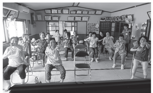
介護保険事業や介護予防事業