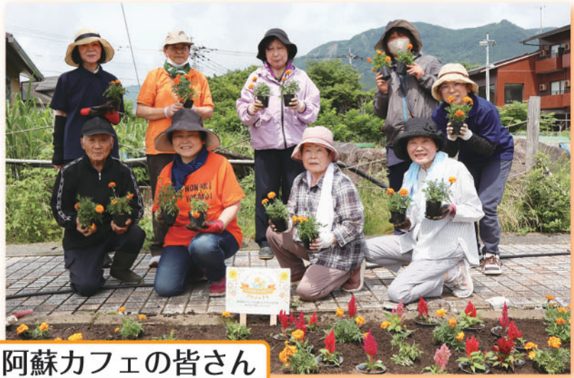
阿蘇カフェの皆さん