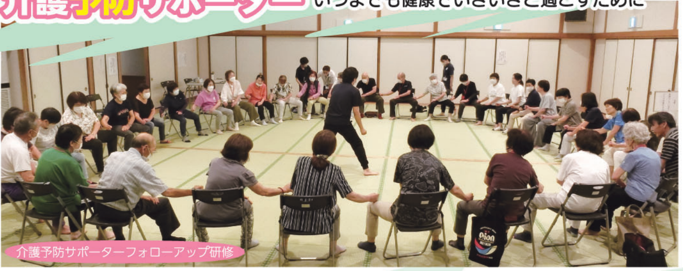
介護予防サポーターフォローアップ研修