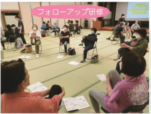
フォローアップ研修