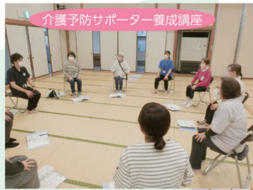
介護予防サポーター養成講座