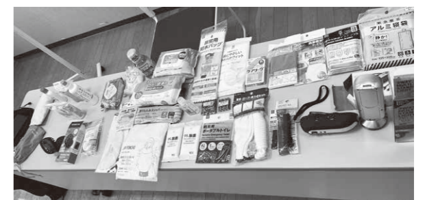
非常用持ち出しパックの中身