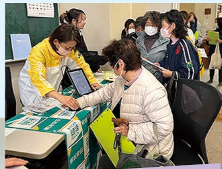
明治安田生命さん 血管、ベジチェック