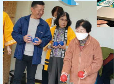
ポッチャ、モルック体験