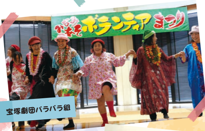
宝塚劇団バラバラ組