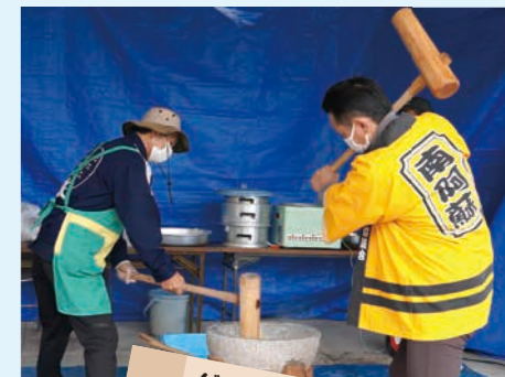
グリーンコープさん 餅つき体験