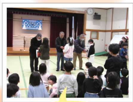
子どもたちが手作り のプレゼントをお渡し！