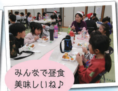
みんなで昼食 美味しいね♪