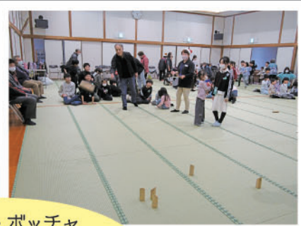
モルック・ポッチャ かるた・射的と楽しく ゲームを行いました♪