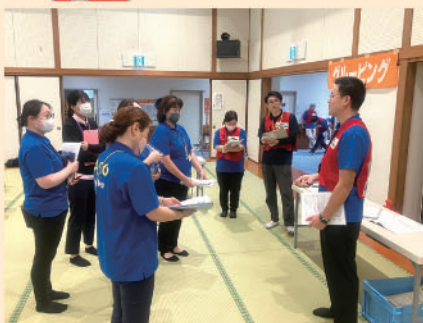
災害ボランティア設置訓練