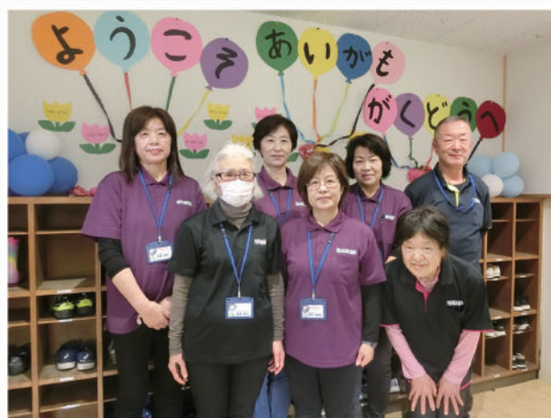
場所：阿蘇西小学校低学年棟