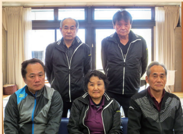
一の宮高齢者センター・温泉センター職員