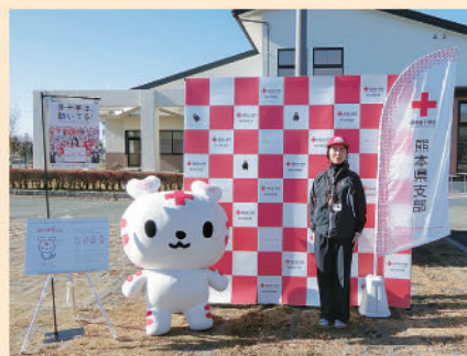
ふれあいまつり・日赤コーナー