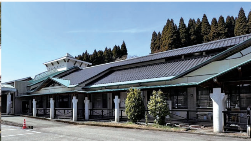
波野支所（波野診療所と同じ建物）