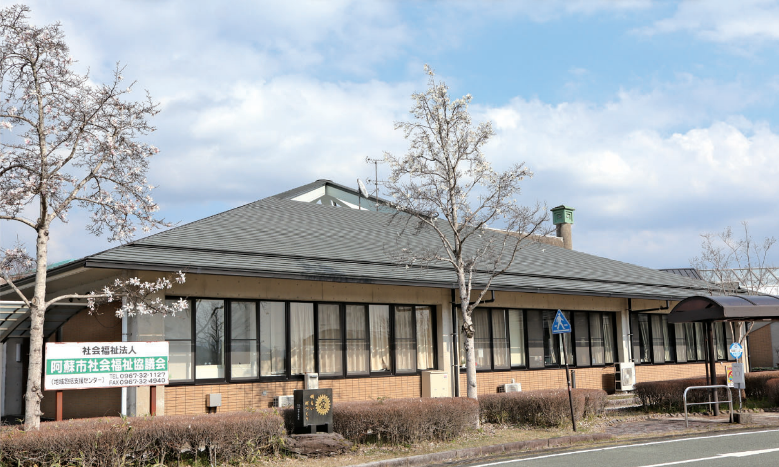
内牧本所（阿蘇市役所内牧支所敷地内）