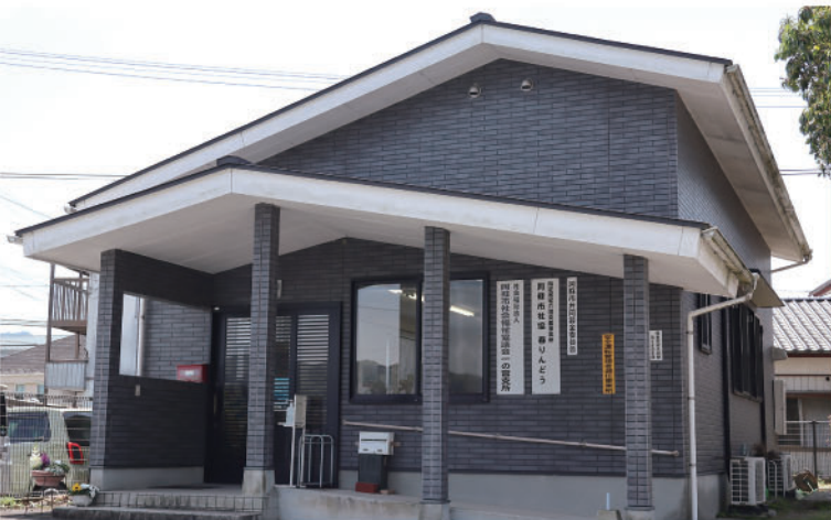
一の宮支所（阿蘇市役所敷地内）