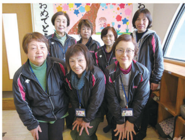
場所：内牧小学校体育館 2 F