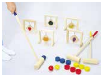
フルーツゲートボール