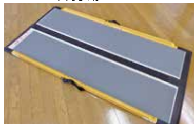
車椅子用スロープ