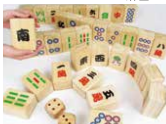
コミュニケーション麻雀