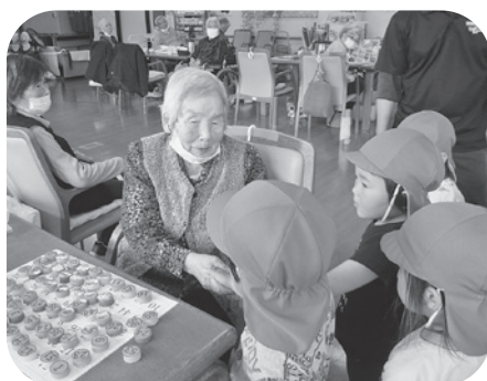
子どもたちも遊びに来てくれました(^^)