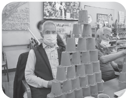
高く積み上げました～

皆様に、自由な時間を利用して好きな活動に参加していただいています。個人で集中して取り組まれたり、同席の方と一緒にゲームに参加されたりと活動は様々です。出来上がった作品はご希望があれば廊下やデイルームに展示しています。