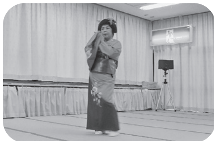
しとやかで素敵です！