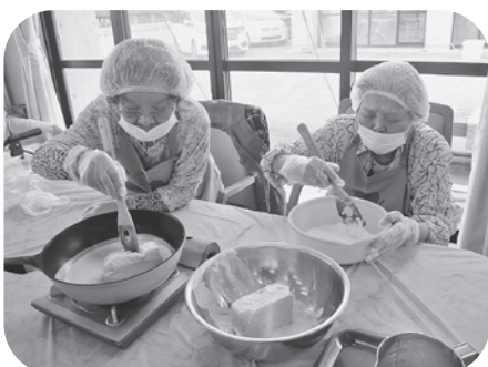
市販のアイスで簡単わらび餅！