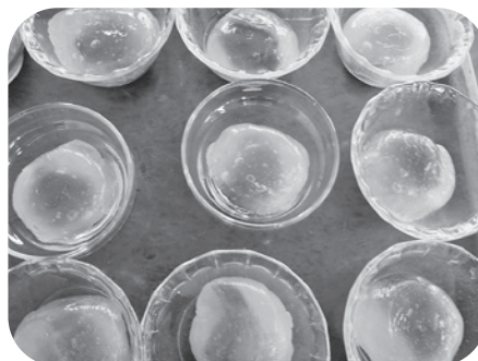
水まんじゅうの出来上がり！