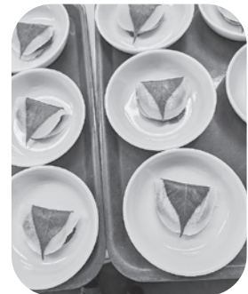
美味しそうな桜餅の完成！