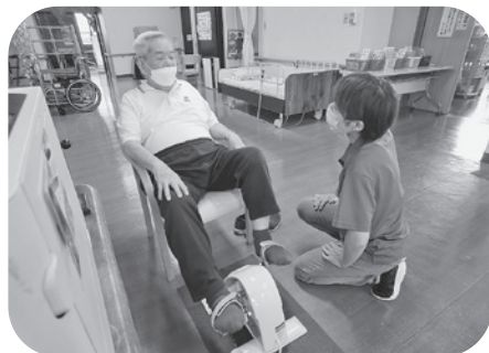
エアロバイク頑張ってます。