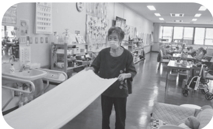
シーツたたみのお手伝い

..... 安全には十分配慮しながら、枕カバーの交換や洗濯物たたみ、寝具の片付け等お手伝いしていただいています。皆さん意欲的にご協力していただいているので職員も助かっています^^