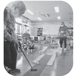
手作りゴルフ大会！