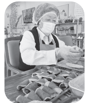
包むのもお手の物(^^)