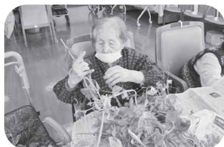
慣れた手つきです。