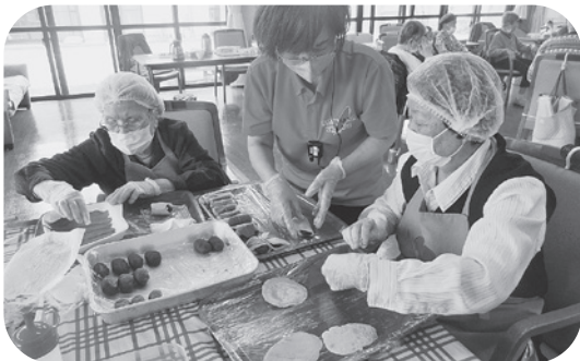
美味しそうな桜餅ができてます。