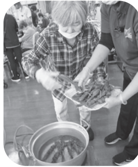
しっかりと湯がきます。