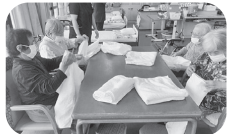
洗濯たたみも手際がいいです。