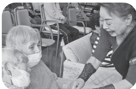
また来てくださいね！♥