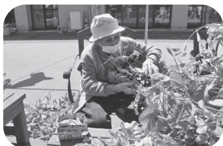
たくさん実ってます (^ ^)

中庭の花壇で、毎年家庭菜園を作っています。今年はスナップエンドウと落花生を植え、実った野菜は皆さんと一緒に収穫し、昼食時に召し上がっていただきました。「次は何ば植えようかな～」と皆さん生き生きと話し合っていました^^