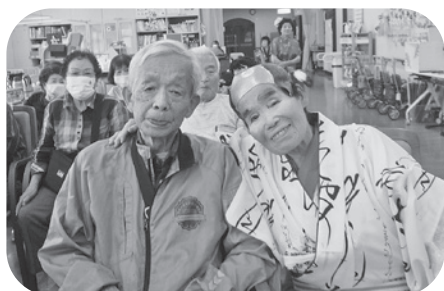
ご夫婦でパシャリ (^ ^)