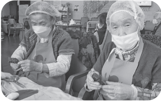
手際よく巻かれています^^

活動の一環として定期的に昼食やおやつ作りを行っています。4月は「桜餅」、5月は「ちまき」、6月は「水まんじゅう」、7月には「わらび餅」等々、季節を感じられるようなメニューを取り入れて、生活機能の維持に繋がられるよう取り組んでいます。