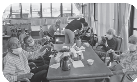
それぞれの作品ができました(~~)