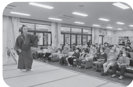
皆さん真剣に見入られています。