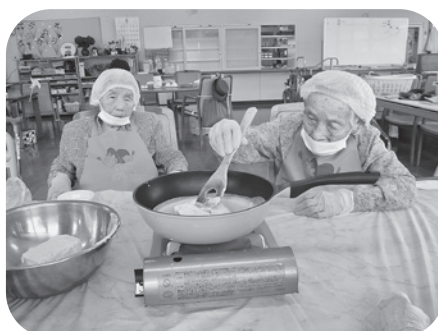
しっかり溶かして～！