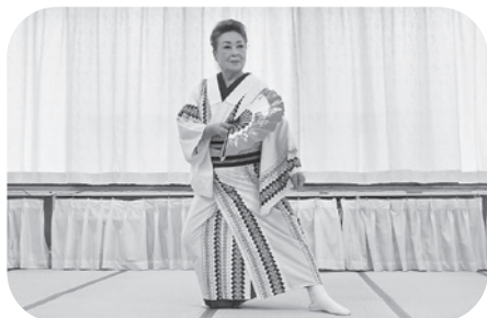
美しい立ち居振る舞い！

山麓会の皆様に舞踊の披露に来ていただきました。とても素敵な踊りに皆さん真剣に見入られてました。若い頃に舞踊を習われていた方も数名おられ、終わった後には力強い握手や記念撮影をさせていただきました。