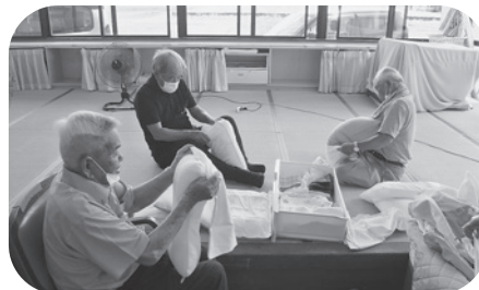
枕カバー交換のお手伝い