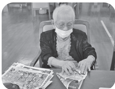
ちりばこ作りも助かります。