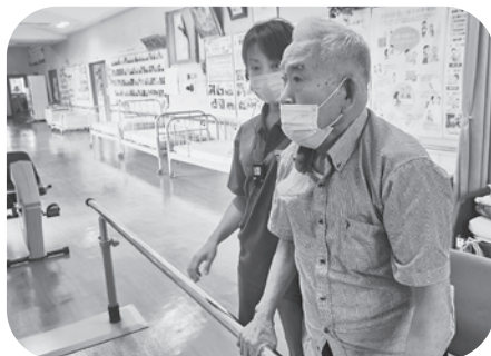
立ち上がりの訓練も！