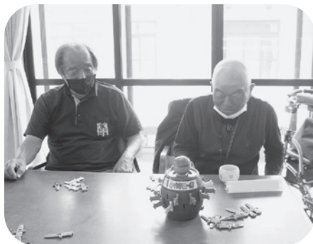
黒ひげ危機一髪で対決！