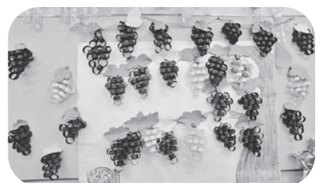
ぶどうの壁紙完成！