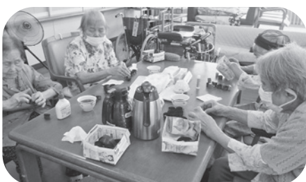
みんなでぶどうの飾りを作ります。