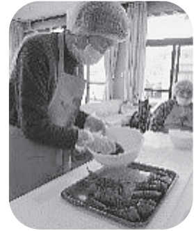
ちまきがたくさんできました～