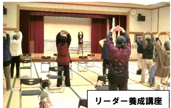
リーダー養成講座