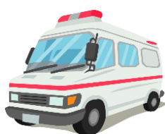
阿蘇広域消防署の声

1人暮らしの高齢者宅に行った際、この【緊急連絡票】のおかげで、ご本人の基本情報が分かり、家族にいち早く連絡することができて助かっています!